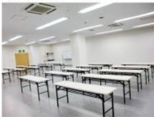
A・Bホール使用例（50～60名収容）

セミナーからミーティングまで、あらゆるコミュニティースペースとしてご利用ください。